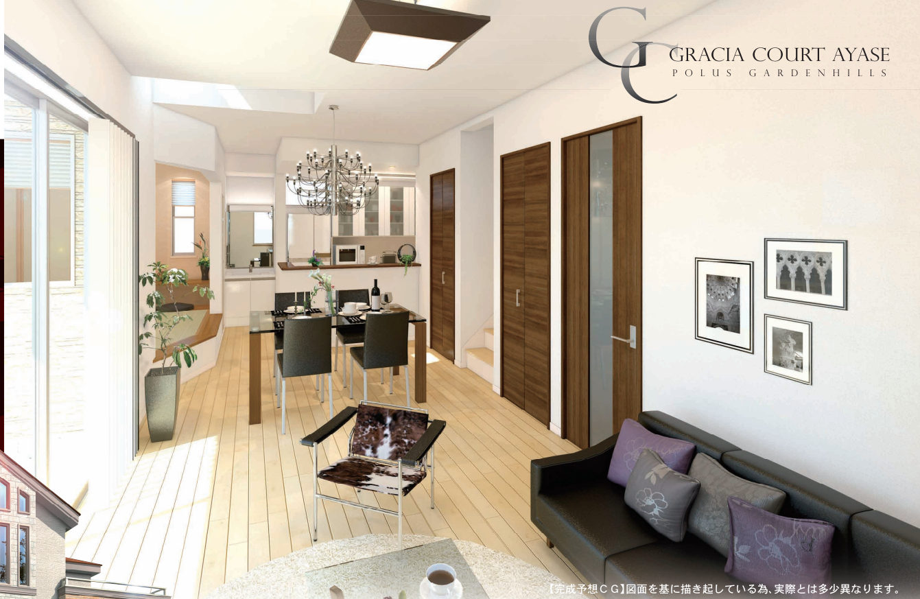
【完成予想CG】図面を基に描き起している為、実際とは多少異なります。