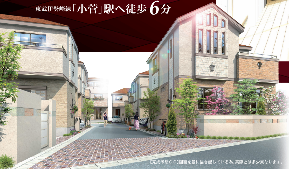
【完成予想CG】図面を基に描き起している為、実際とは多少異なります。