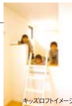
キッズロフトイメージ

リビング上部にある吹抜けにより、光が差し込み開放的な空間で、吹抜上に生まれた2Fの空間はロフトに、秘密基地のようなプライベート空間にも、季節ものをしまう収納にも使える便利な空間です。