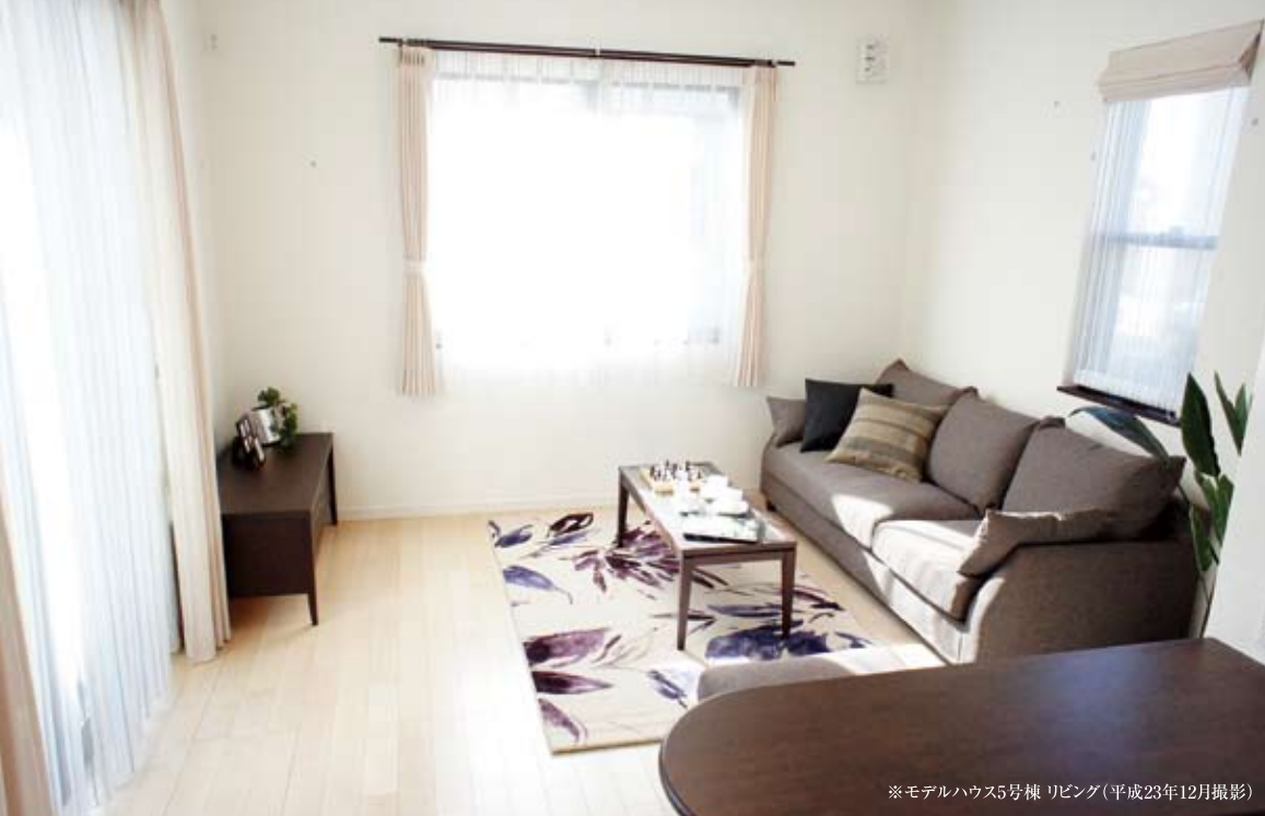
※モデルハウス5号棟 リビング(平成23年12月撮影)