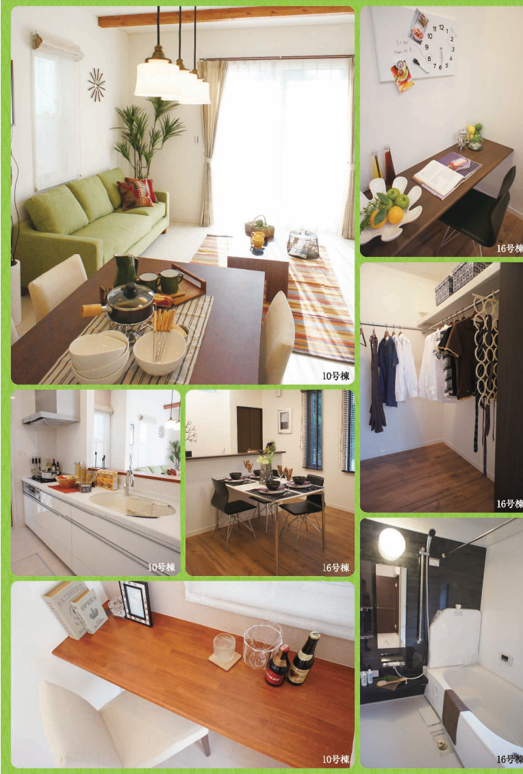
※掲載の写真は10号棟(平成23年12月撮影)・16号棟(平成23年6月撮影)のモデルハウスを撮影したものです。家具等は販売価格に含まれません。