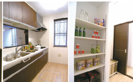
落ち着いた色のパナソニックのキッチン横のユーティリティシステムキッチン