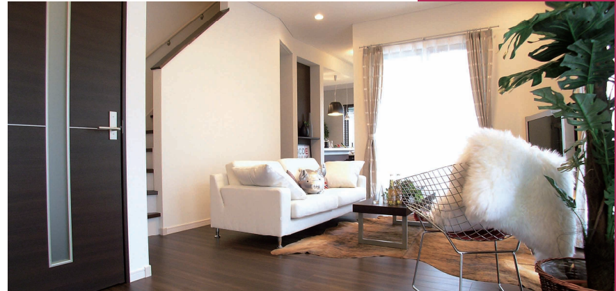
ハイコントラストのインテリアカラーが都会的な空間に演出、床暖房付きの南向きのLDK