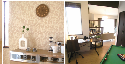
お洒落なアクセントクロス