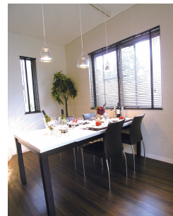
明るいダイニング