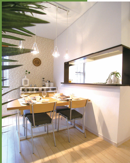
南向きのお庭を面した明るい対面キッチン&ダイニング