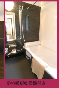
浴室暖房乾燥機付き