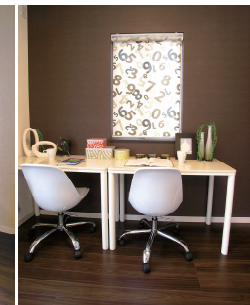
落ち着いたアクセントクロス