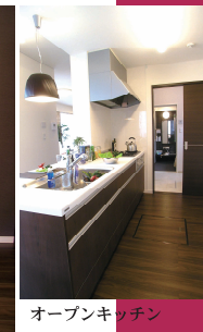
オープンキッチン