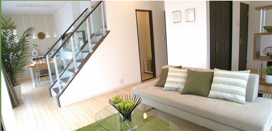
家族がコミュニケーションしやすい、個性的なリビングイン階段が、LDKをスタイリッシュ空間に演出