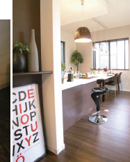
色も統一されたモダンなパナソニック水廻り設備