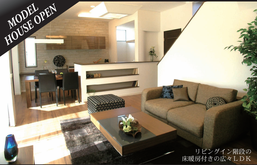
リビングイン階段の床暖房付きの広々LDK