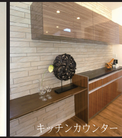
キッチンカウンター