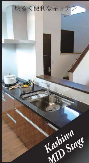
明るく便利なキッチン