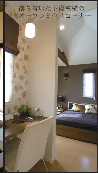
落ち着いた主寝室横のオープンミセスコーナー