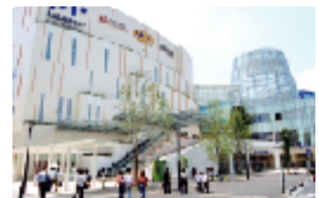
ららぽーと柏の葉 (4370m)